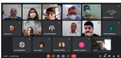
Planejamento Pedagógico, 2022.