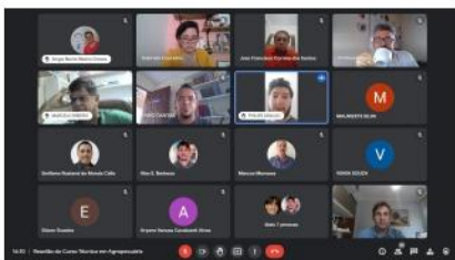
Planejamento Pedagógico, 2022.