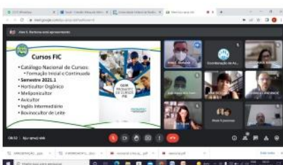
V Workshop da Equipe Gestora, 2022.