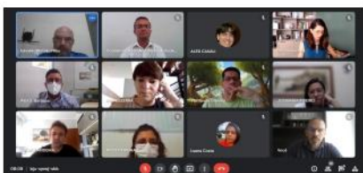
V Workshop da Equipe Gestora, 2022.