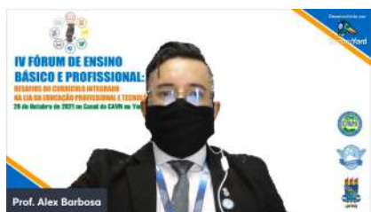
Foto 01. Abertura do IV Fórum de Ensino Básico e Profissional, 2021.