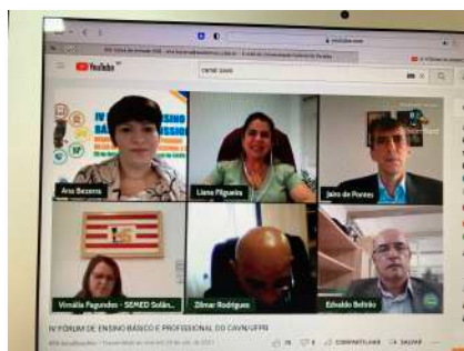
Foto 02. Mesa de Abertura do IV Fórum de Ensino Básico e Profissional, 2021.