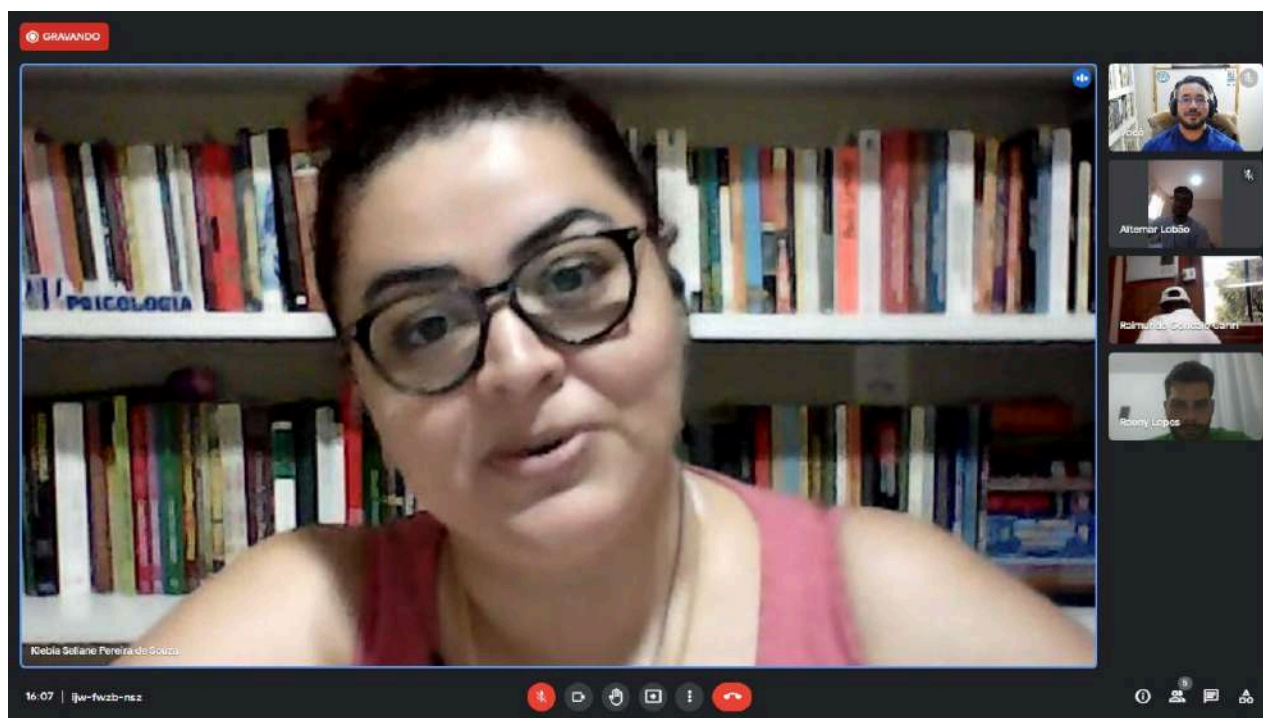
Foto 07. Reunião sobre Internacionalização, 2021.