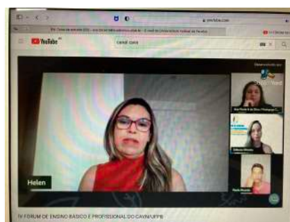
Foto 04. Mesa Redonda do IV Fórum de Ensino Básico e Profissional, 2021.