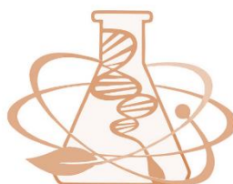
Técnico em Laboratório de Ciências da Natureza CAVN | UFPB