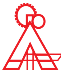
Técnico em Agroindústria CAVN | UFPB