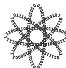
Técnico em Informática CAVN | UFPB